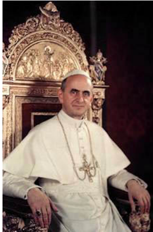
Giovani Baptista Montini – Paul VI

Ce canon 75 (anciennement 235) démontre en outre le caractère résolu et parfaitement mensonger du texte la Constitution apostolique Pontificalis Romani de Montini-Paul VI par lequel, le 18 juin 1968, ce dernier promulguait, en la justifiant fallacieusement, cette pseudo consécration épiscopale sacramentellement invalide et entièrement fabriquée par ses agents, pour l'imposer depuis lors à l'Eglise Catholique :