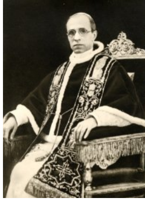
Pie XII qui promulgua motu proprio la lettre apostolique Cleri Sanctitati (2 juin 1957)