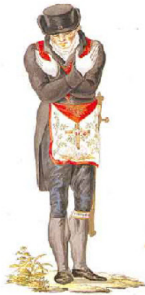
Chevalier du R.E.R.

Le rite d'initiation au 30ème degré ou "Chevalier Kadosh", grade dite "de vengeance", du rite maçonnique britannique écossais ancien et accepté REAA comporte en particulier le fait pour l'impétrant de poignarder un "mannequin" couronné représentant le Roi Philippe le Bel, et un second "mannequin" coiffé de la tiare papale représentant le Pape Clément V.