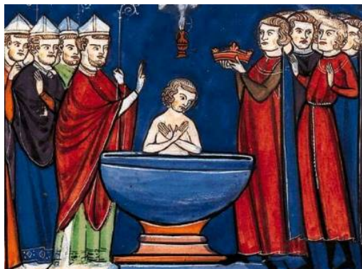
Baptême et sacre du Roi Clovis par Saint Rémy Apparition de la colombe apportant la fiole du Saint-Chrême

Les Traditions françaises ont rapporté que de ce premier sacre date la mission divine des Francs pour la protection temporelle de la Sainte Église.