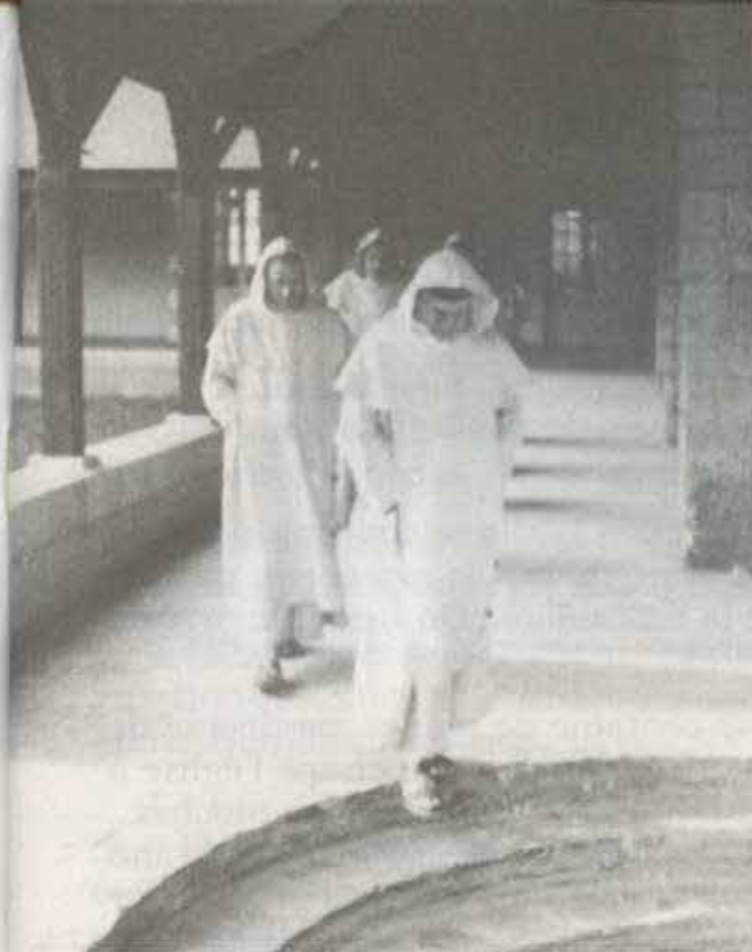
Le cloître : lieu traditionnel de recueillement pour la communauté qui compte quatre prêtres, six frères et trois postulants.