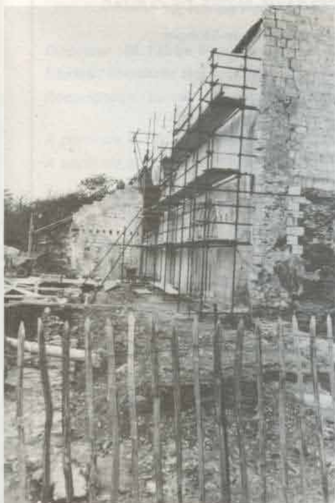
Les travaux se poursuivent : la reconstitution du portail.