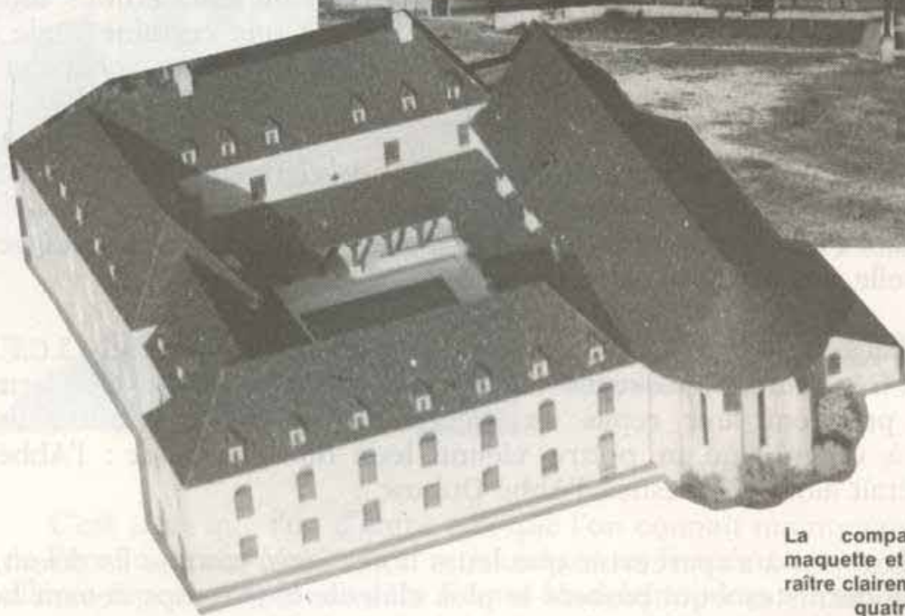
La comparaison entre la maquette et la réalité fait apparaître clairement l'absence de la quatrième aile du cloître.

A Paris, un prêtre leur fait découvrir les merveilles de l'Année liturgique. Dans un cadre bénédictin ils sont saisis d'admiration par la beauté du chant grégorien, par la splendeur des cérémonies.