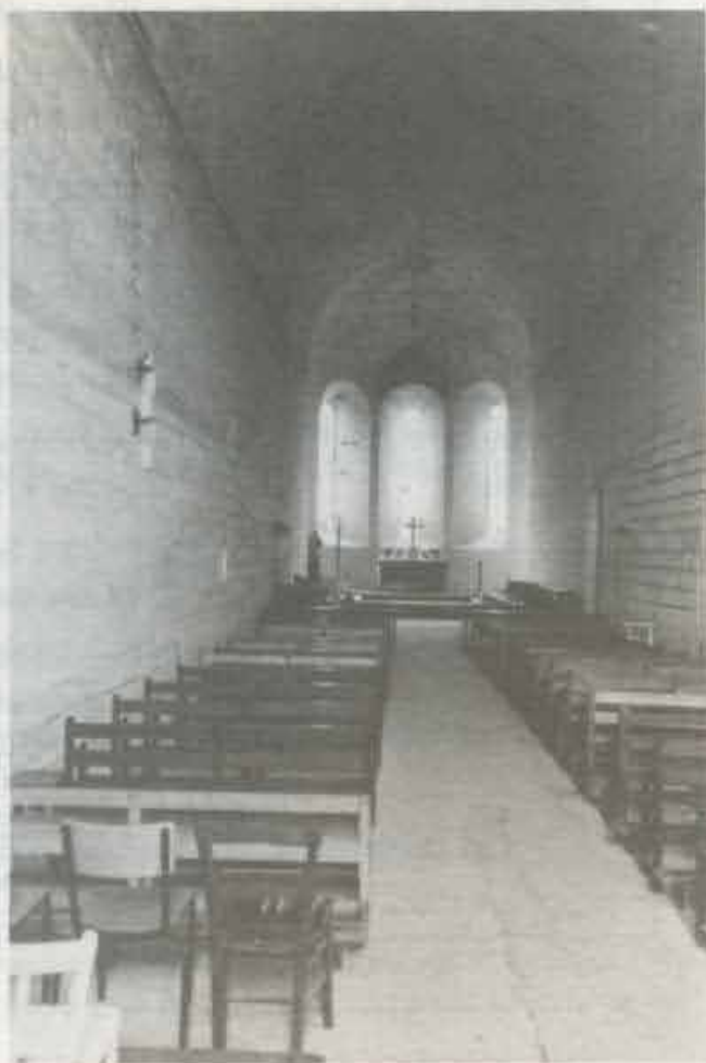
La chapelle, heureusement restaurée, l'un des rares édifices subsistants de l'art grandmontain (XII-XIII e ).