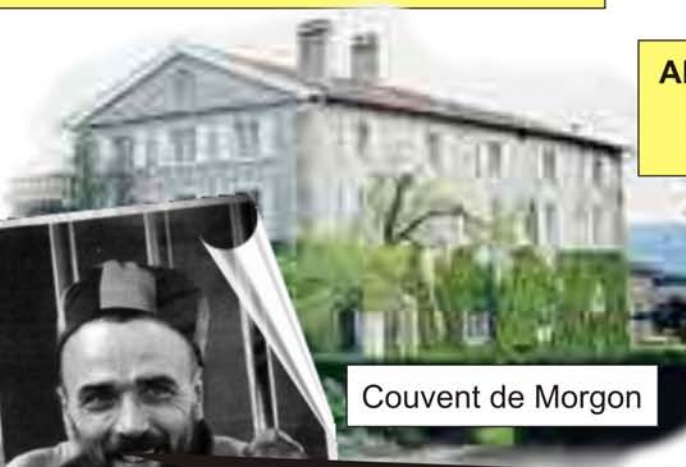
Couvent de Morgon