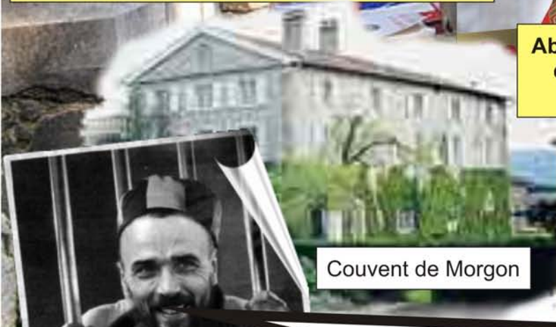
Couvent de Morgon