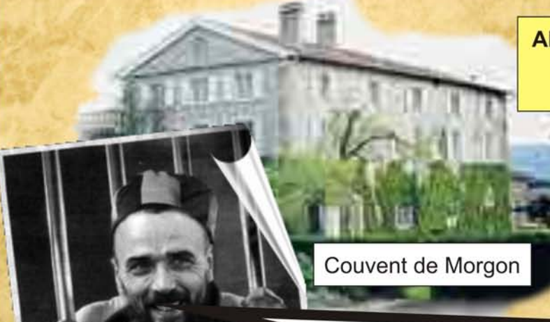
Couvent de Morgon