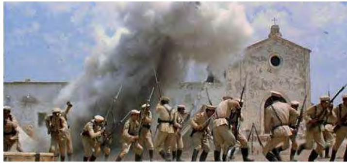
L'armée mexicaine en déroute