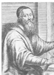
John A. Comenius

Désormais la Bête de la Terre peut rencontrer la Bête de la Mer !