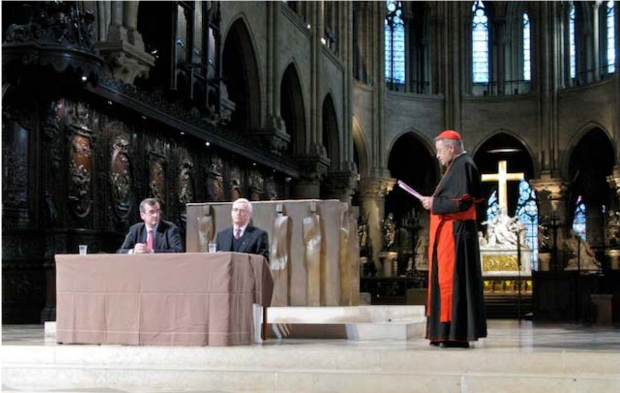
Le pseudo-cardinal André Vingt-Trois, lors des conférences de Carême 2008, dans la cathédrale Notre Dame de Paris. Notez l'abominable "autel", commandé par feu le Cardinal Lustiger en 1989, derrière les deux conférenciers.

La réception de Vatican II depuis plus de quarante ans par l'Église universelle, à travers le ministère de Jean-Paul II et de Benoît XVI , comme par les Églises particulières, par exemple à Paris, et l'écho du Concile largement au-delà de l'Église, manifestent sa riche substance spirituelle et pratique. Même si certains passages paraissent datés, l'actualité de Vatican II est plus vive encore au début du 21ème siècle pour l'avenir de l'Église et du monde qu'au moment de sa promulgation. 8